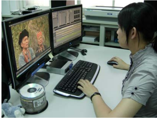
使用剪輯軟體 Edius 製作排灣族影片