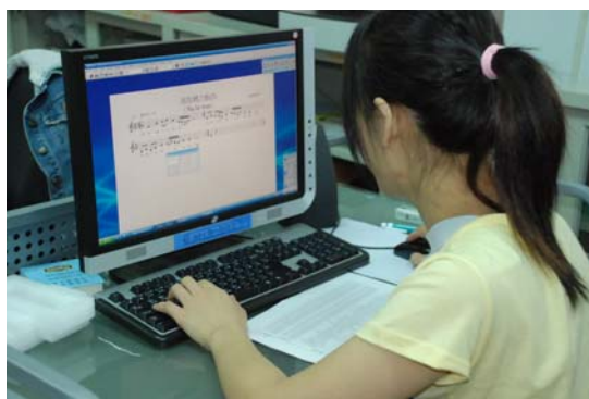
使用樂譜編輯軟體 Sibelius 製作阿美族樂譜