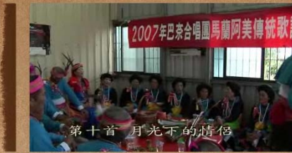
第十首 月光下的情侶