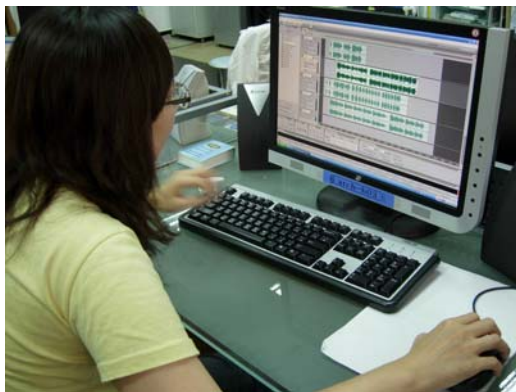
使用聲音編輯軟體 AudioMotion 將聲音檔分軌