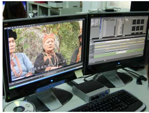
Edius 編輯畫面(排灣族族民)