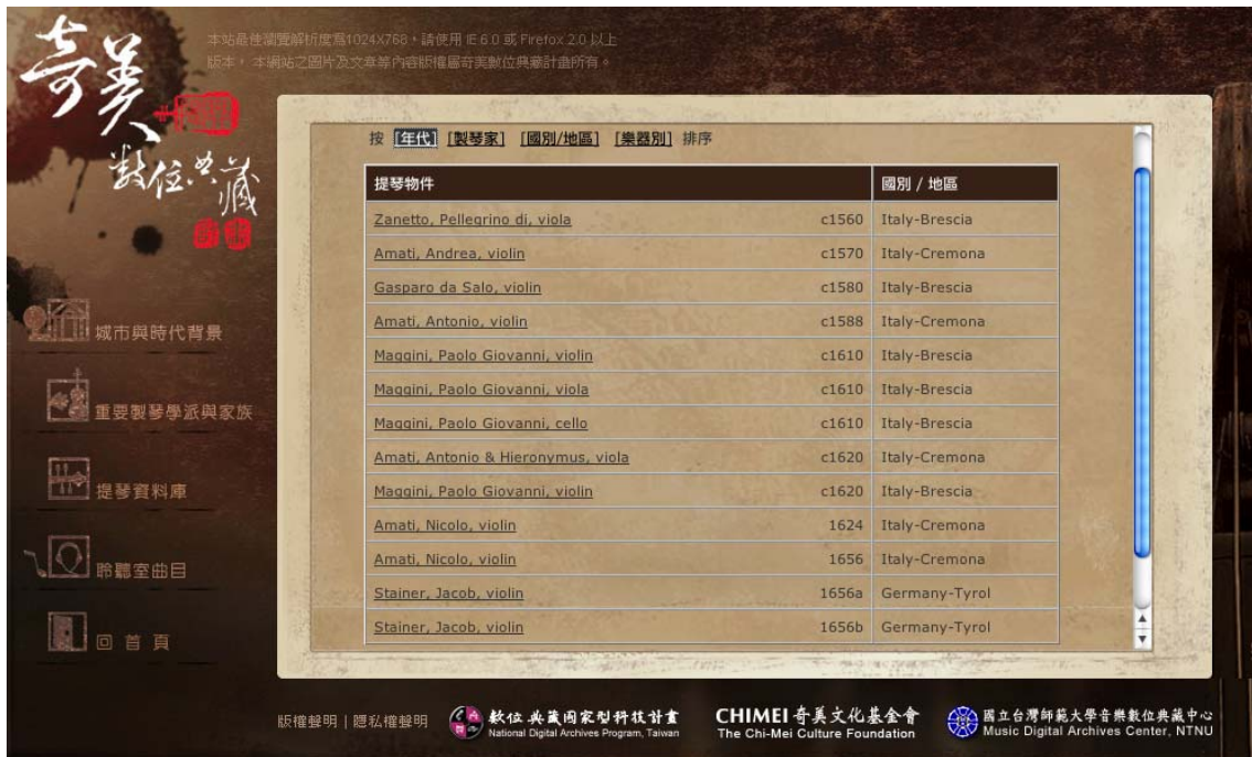
圖十一、可依照條件改變檢索表單