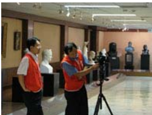
圖四、3D 虛擬場景拍攝 1(台南奇美博物館)