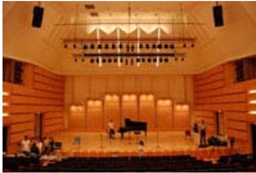
圖六、奇美名琴名曲專輯錄製現場(東吳大學松怡廳)