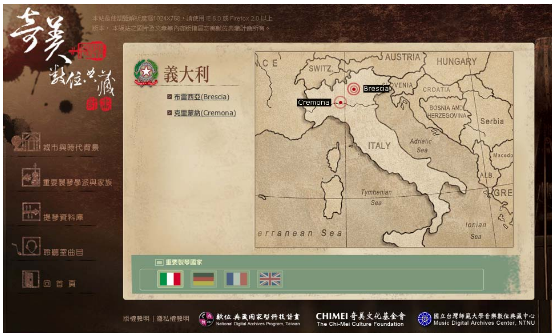
圖十二、以地圖清楚標示製琴地點