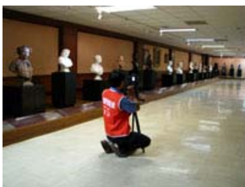
圖五、3D 虛擬場景拍攝 2(台南奇美博物館)