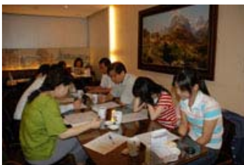
圖一、雙方合作會議(台南奇美博物館)

了解提琴史，討論計畫所要研究的國家、學派、奇美館方收藏情況，同時期提琴研究範圍寬廣，先鎖定在義大利，以製琴地區為一單位，分配研究工作。