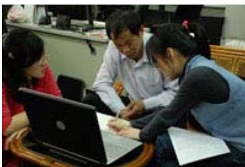
圖二、提琴文獻探討 (師大音樂數位典藏中心)