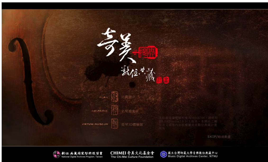
圖十、網站首頁以提琴為背景